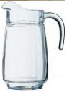
Ąsotis, 2 l.