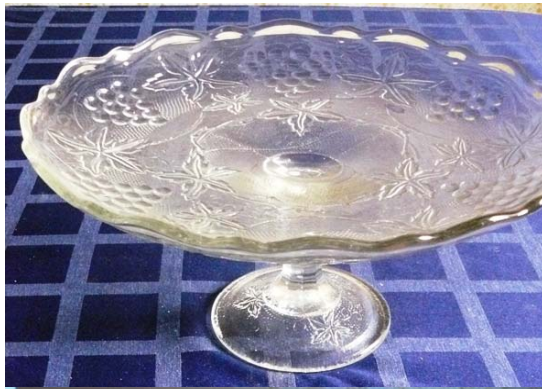
Vaisinė, Ø 28 cm., h-140 mm.