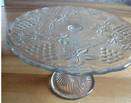
Tortinė Ø 29 cm., h- 140 mm.